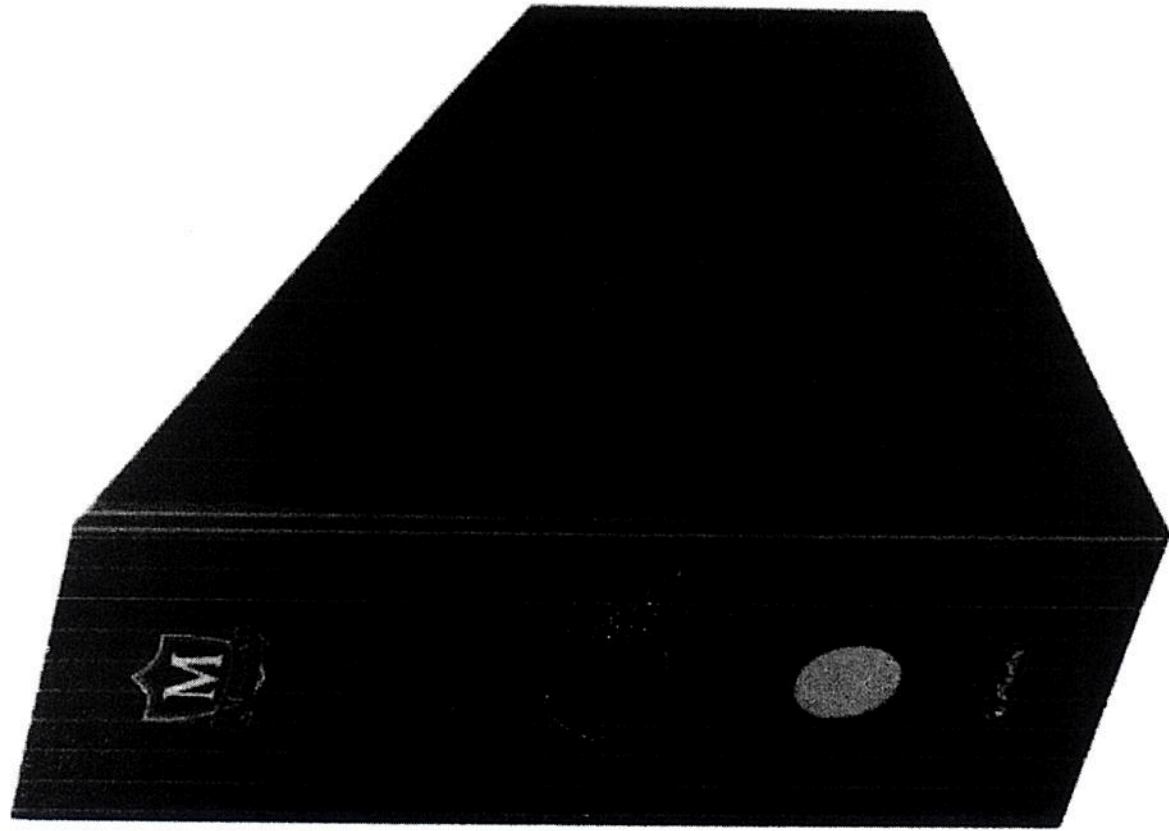
Support dosare A4, carton, Montana IV albastri